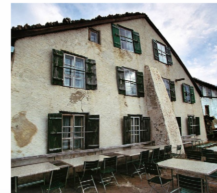
Noch heute schläft man im Berghotel Faulhorn (Bild oben) in Biedermeierbetten aus der Gründerzeit (unten).

Steil und schlau «Der Abschnitt vom Faulhorn nach Gassenboden ist der gefährlichste und steilste. Passen Sie dort auf! Damit man im Schlussteil weiss, wann mit Gegenverkehr gerechnet werden muss, studieren Sie vorher den Busfahrplan.»